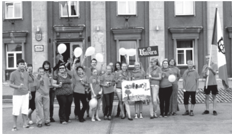
Malevasuve avamine Jõhvi keskväljakul.

Kuid ega malev ei ole ainult töötegmine, eriti kui tegemist on kuue valla ühismalevaga. Iga vald sai ülesandeks korraldada ühe ühisürituse. Jõhvis toimus pidulik avamine, mille käigus said noored vallavanemate poolt malevlasteks ristitud, samuti tuli neil anda kelmikas vanne. Vaivara rühm viis kaaslaste seiklema Sinimägedesse. Seiklemine tähendas matkamist, vaatetornist laskumist ja paintballi lahingut. Koos liisaku rühmaga peeti maha korralik sünnipäevapidu Peipsi rannas, mis sisaldas kuidugi vahvaid mängu rannas ja ülisuurt torti, millest jagus üle 130le külalisele. Mäetaguse noored kutsusid kaaslasti etnosussi keerutama oma värskest renoveeritud rahvamaja. Meie füüsilise vormi eest kandsid hoolt toilakad, kes korraldasid spordipäeva, mille käigus sai esmalt tegelda aeroobikaga ja seejärel orienteeruda Toila Oru pargis.