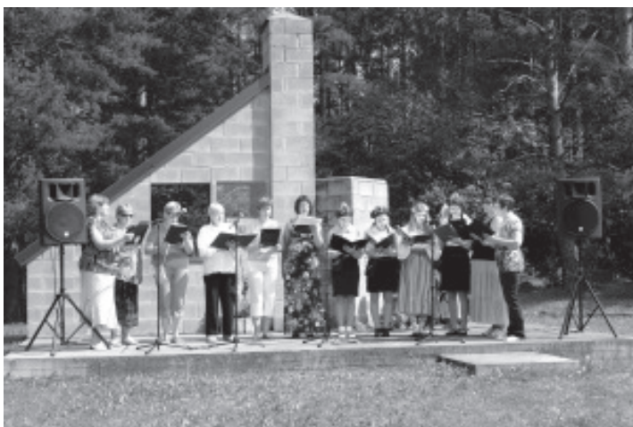
Sõna on lauljatel. Foto: 2x IRINA KLISHINA

http://album.vaivaravald.ee > Külaskäigud