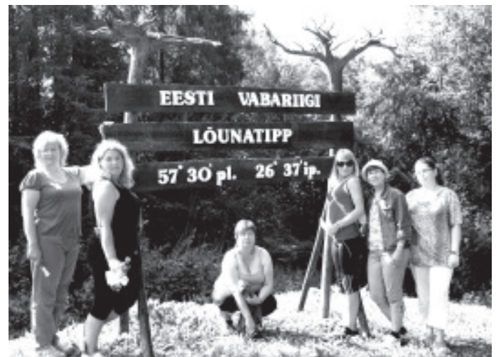
Fotomälestus lõunatipu juures.

Õhtusel simmanil leidis igati endale meelepärast tegevust, kuid sära ja särtsu aitasid lisada tipuvaldade kokkutuleku üheks kaubamärgiks saanud Olgina rahvamaja köhutantsijad. Kohapeal improviseeritud ühine tantsutund pani nii mõnegi osaleja otsustama, et aeg on isegi selle vahva huvialaga tegelema hakata. Viimasel hommikul jagunesid osalejad