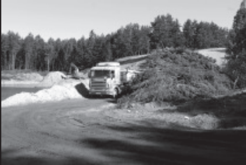
Riigiküla karjäär tehakse korda.

Endine Riigiküla karjäär asub Vaivara vallale kuuluval Tornimäe külas. Liiva on sealt kaevandatud alates 1960-ndatest ja lõpetatud 1980-ndate aastate alguses. Liiva kasutati nii ehituses, kui ka ehitusmaterjalide tootmises.