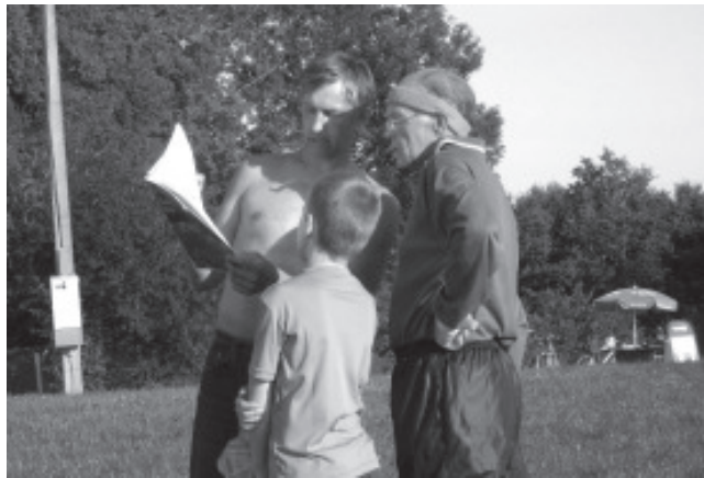
Pärast võistlust vaadatakse oma liikumine kaardil kriitilise pilguga üle.