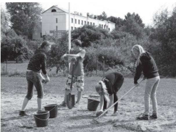
Работы на стадионе в Синимяэ были самыми тяжелыми.

Проведенные в дружине две недели для Вайвараского отряда были очень деятельными, и находить время для