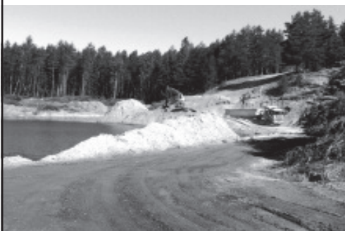
Песчаный карьер в Рийгикюла будет приведен в порядок.

Бывший песчаный карьер Рийгикюла расположен на принадлежащей Вайварской волости территории земельной единицы Торни в деревне Кудрукюла. Песок с этого карьера добывался с 1960 года до начала восьмидесятых годов прошлого столетия и использовался как в строительстве, так и в производстве строительных материалов.