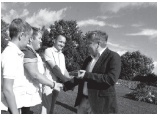
Региональный министр Сийм Вальмар Кийслер вручает семье Объяртель награду.

По словам старейшины уезда Андруса Ноормяги последние два года он имел честь заниматься вопросами развития сельской