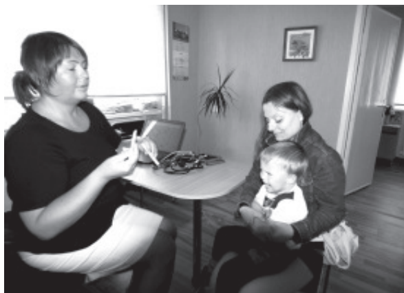
Маленький пациент на приеме у семейного врача.