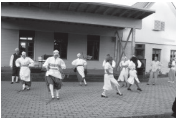
В разгаре танца

http://album.vaivaravald.ee > Külaskäigud