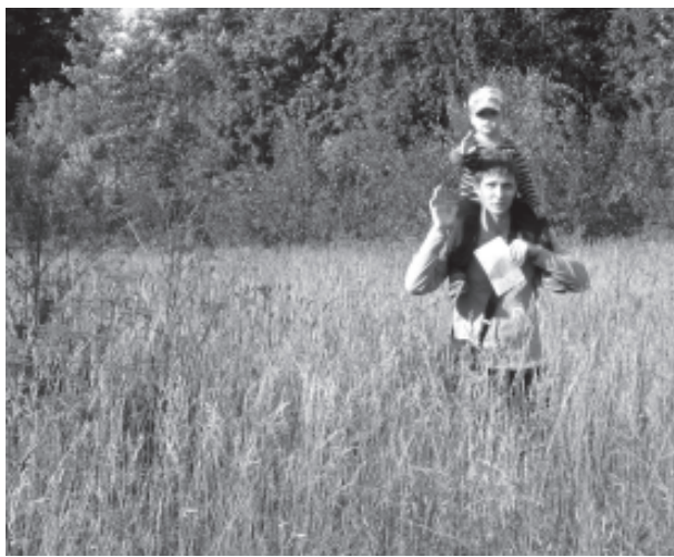
Трава местами была выше человеческого роста.