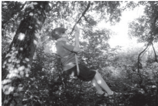
На крутизне.